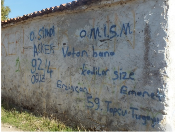
“O şimdi asker. OĞUZ 92/4 Erzincan” “Vatan bize kediler size emanet, 59. Topçu Tugayı” Fotoğraf:11 Yenice Mahallesi, 03.11.2013.