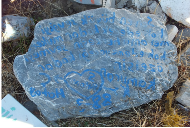
Fotoğraf:5 Dirgeme/Akkaya Eren Mahalli, 15.10.2013.