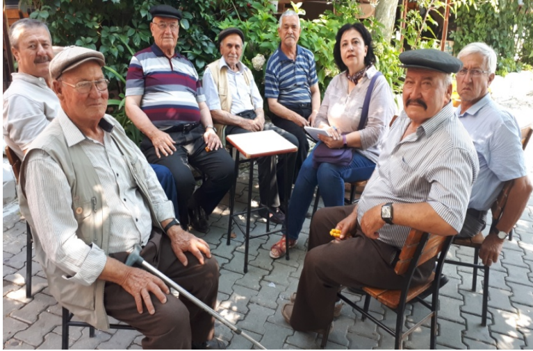
Kaynak kişilerle ile yapılan görüşmeden bir fotoğraf. Fotoğraf:8 19.07.2019.