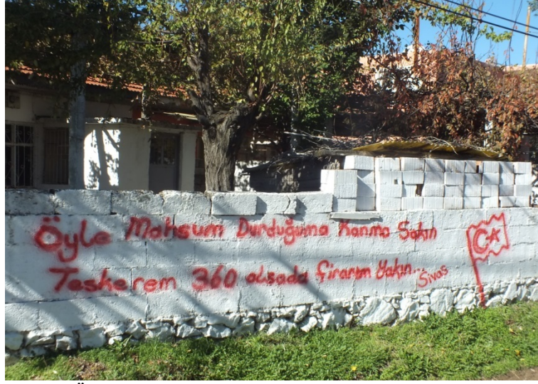
“Öyle mahsum (masum) durduğuma kanma sakın, tezkerem 360 olsa da firarım yakın, Sivas” Fotoğraf:24 Doğanköy Mahallesi, 08.11.2013.