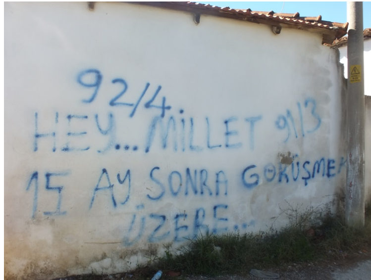
“92/4 Hey... Millet 15 ay sonra görüşmek üzere, 91/3” Fotoğraf:17 Doğanköy Mahallesi, 08.11.2013.