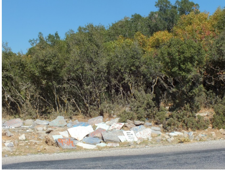
Fotoğraf:1 Dirgeme/Akkaya Eren Mahalli, 15.10.2013.