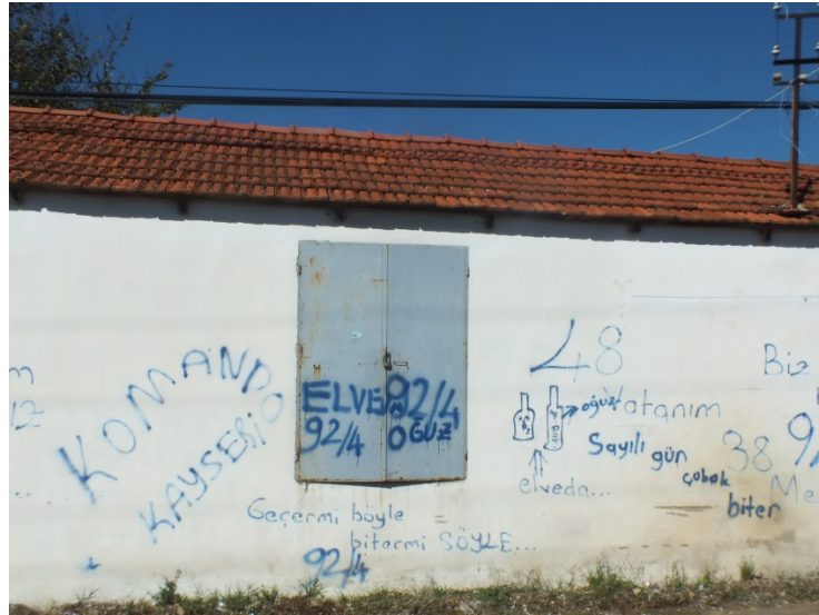
(Bir süreliğine içkiye ara vereceğinin resmi.) “Elveda, sayılı gün çabuk biter” Doğanköy Mahallesi, 08.11.2013.