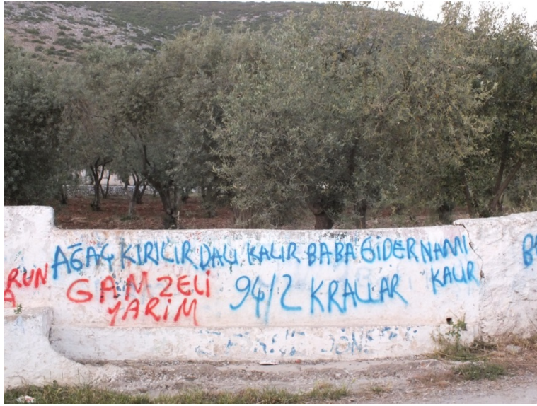
“Ağaç kırılır dalı kalır baba gider namı kalır 94/2 Krallar” Fotoğraf:32 Dirgeme/AkkayaMahallesi, 25.05.2014.