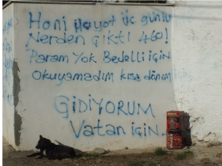
“Hani hayat üç gündü nerden çıktı 460! Param yok bedelli için okuyamadım kısa dönem.” “Gidiyorum vatan için.” Fotoğraf:12 Yenice Mahallesi, 03.11.2013.