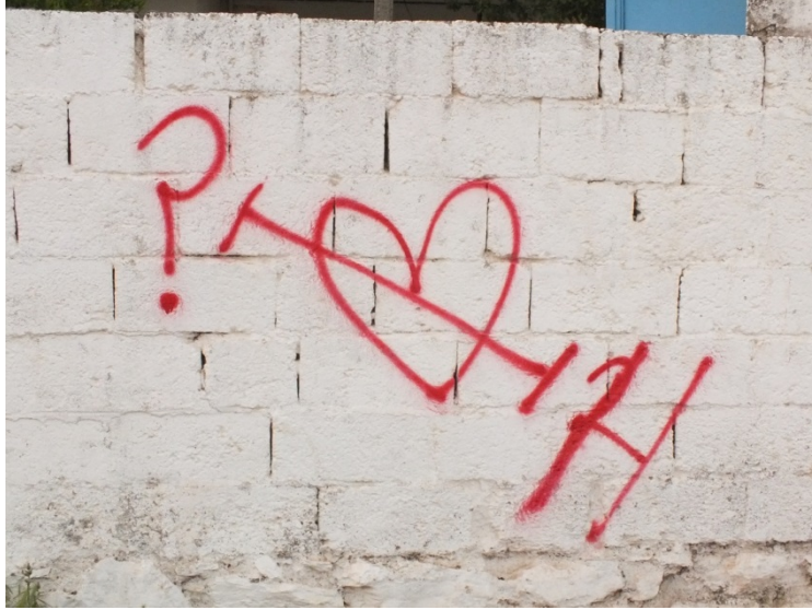
Kalp resmi Köyde kızın adını deşifre etmemek adına ters soru işareti ile yapılan gönderme Fotoğraf:34 Dirgeme/Akkaya Mahallesi, 25.05.2014.