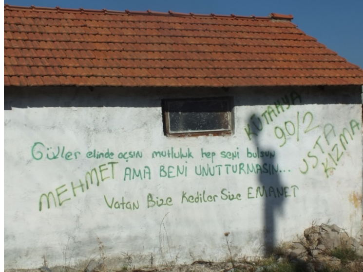
“Güller elinde açsın mutluluk hep seni bulsun ama beni unutturmasın. MEHMET 90/2”

“Vatan bize kediler size emanet” “Usta Kızma!”