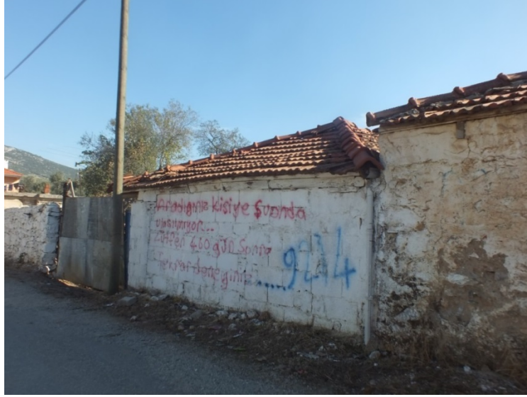
“Aradığınız kişiye şu anda ulaşamıyor Lütfen 460 gün sonra tekrar deneyiniz. 92/4” Fotoğraf:9 Yenice Mahallesi, 03.11.2013.