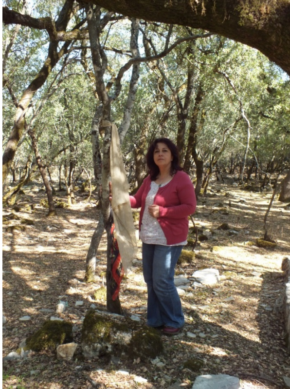
Askerden dönen gençler için kurban kestikleri yer.