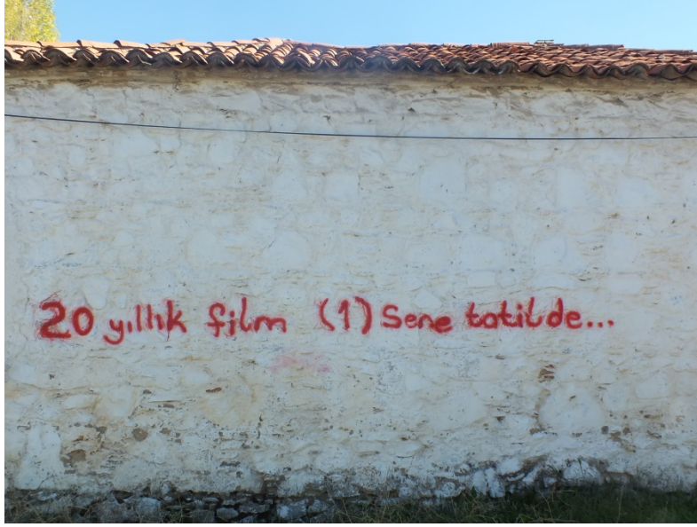
“20 yıllık film (1) sene tatilde” Fotoğraf:16 Doğanköy Mahallesi, 08.11.2013.