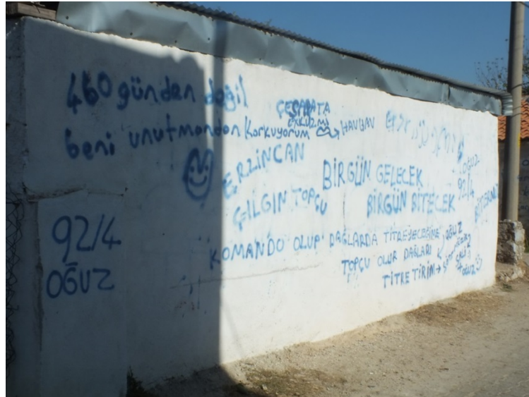
“460 günden değil beni unuttuğundan korkuyorum. Çılgın Topçu. OGUZ 92/4 Erzincan” “Bir gün gelecek bir gün bitecek” “Komando olup dağlarda titreyeceğime topçu olup dağları titretirim” Fotoğraf: 23 Yenice Mahallesi, 03.11.2013.