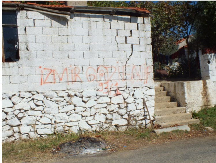
“İzmir Gaziemir 93/1” Fotoğraf:37 Yenice Mahallesi, 03.11.2013.