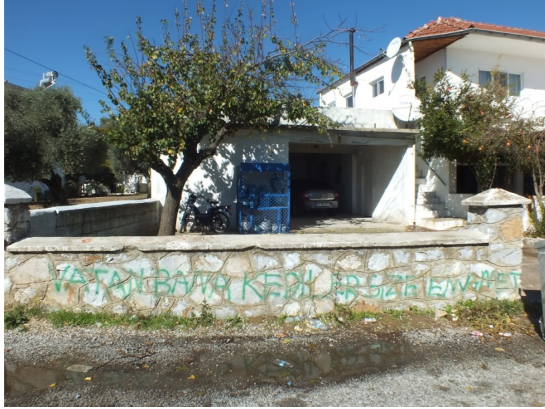
“Vatan bana kediler size emanet” Fotoğraf:18 Yenice Mahallesi, 03.11.2013.