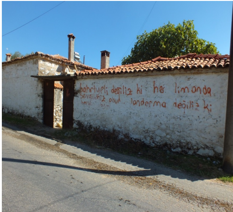
Bahriyeli değiliz ki her limanda sevgilimiz olsun, jandarma değiliz ki..... her gün olayım. Fotoğraf:31 Doğanköy Mahallesi, 08.11.2013.