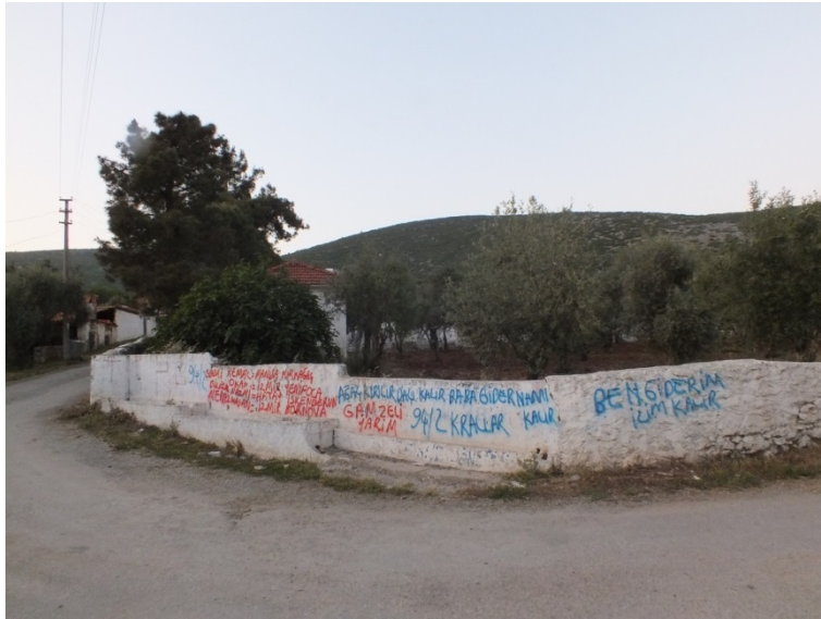
Bir duvardan görünüm. Fotoğraf:39 Dirgeme/AkkayaMahallesi, 25.05.2014.