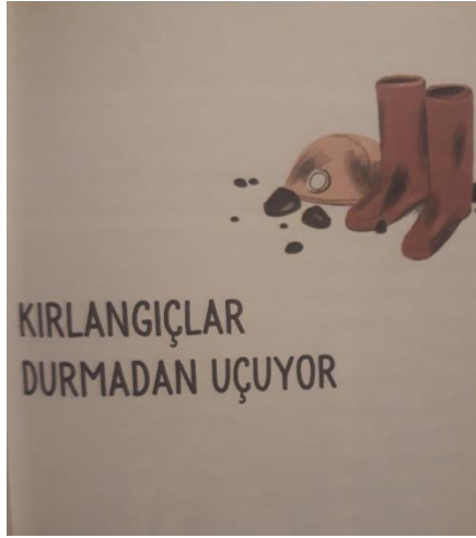
Resim 2. Kırlangıçlar Durmadan Uçuyor başlıklı Öyküye Eşlik Eden Resim

Adı geçen öyküde babasını bir maden kazasında kaybetmiş olan kız çocuğu öykünün ana kişidir. Öykünün başlığının hemen yanında yer alan bu resim kurguda anlatılanı görsel olarak tamamlamaktadır. Kitaptaki tüm öykülerin başlığının yanında bu şekilde öyküyü tamamlayan küçük boyutlu resimler vardır.